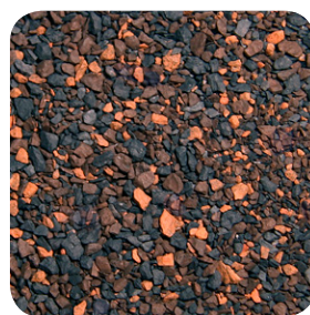
Nogal Americano CC047