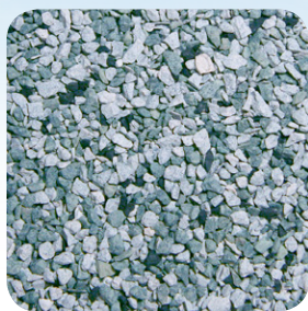
Tono de Plata CC045A