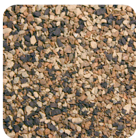
Tono de Madera CC046