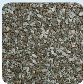
Pizarra Antigua CC003A