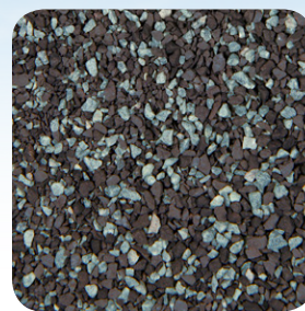
Gris Peltre CC010A