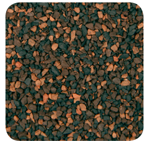
Harvest Brown CC012A