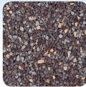
Weathered Wood CC004