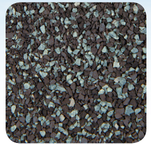
Pewter Gray CC010A