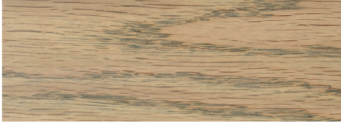
Classic Gray 271