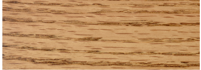
Golden Oak 210B