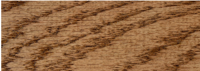
Special Walnut 224