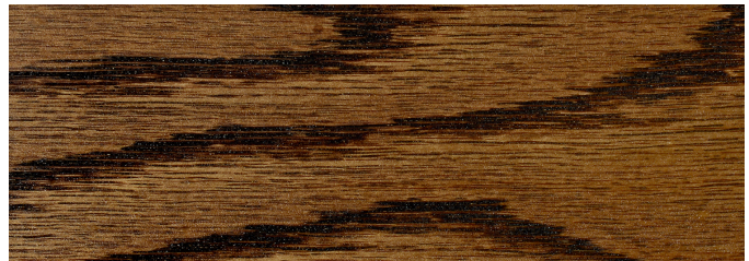
Dark Walnut 2716

The colors shown are for reference purposes only. They have been reproduced using digital production techniques. Always test stain on a hidden area of the wood to verify desired color. Wood species will impact final color. Color will also vary slightly by product technology/type.