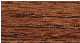
WHITE OAK ROBLE BLANCO