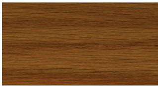
WITH PRE-STAIN WOOD CONDITIONER

SIN ACONDICIONADOR PREVIO AL TEÑIDO PARA MADERA