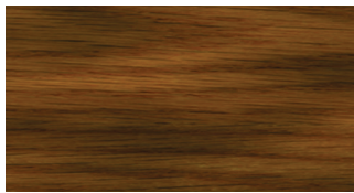
WITHOUT PRE-STAIN WOOD CONDITIONER

SIN ACONDICIONADOR PREVIO AL TEÑIDO PARA MADERA