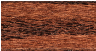
RED OAK ROBLE ROJO