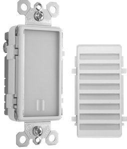
NTLFULL with Optional Louver NTLFULL avec grille en option NTLFULL con rejilla opcional

Country of Origin: Made in China • Pays d'origine: Fabriqué en Chine • País de origen: Hecho en China