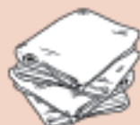
Cloth Paño Chiffon